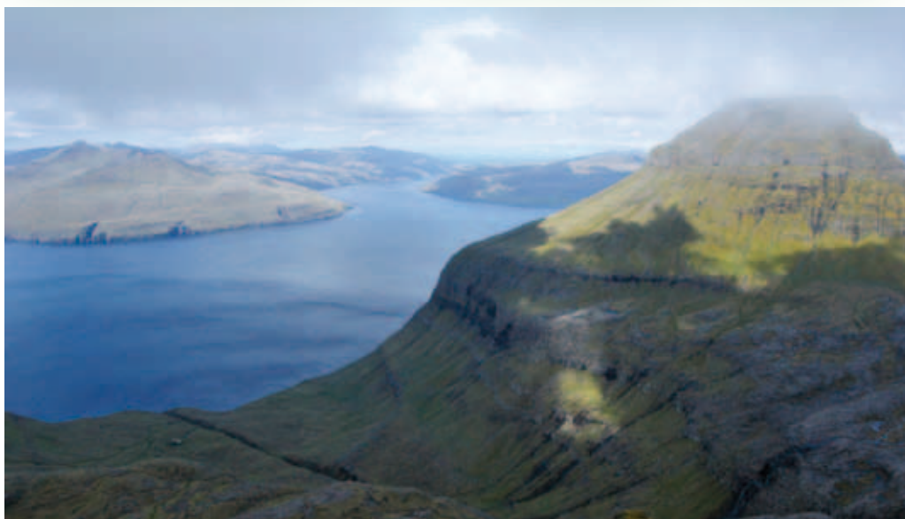
Text och foto: Monika Johansson

Den 26 maj invaderades Färöarna av nästan 300 chefer och ledare från de Nordiska länderna. Det var dags för den nordiska konferens som Ledarnas Nordiska Nätverk(LNN) arrangerar. Deltagarna möttes av ett blåsigt och fascinerande land.